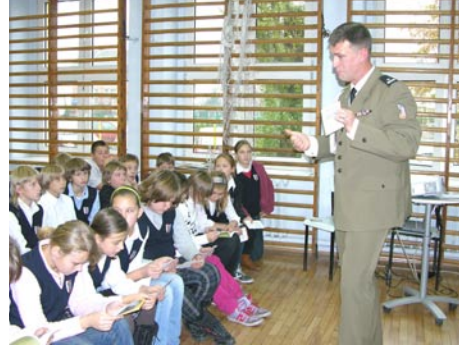
Szkoły wojskowe dla dziewcząt? Dlaczego nie. Początkowy wykład szybko zamienił się w dyskusję